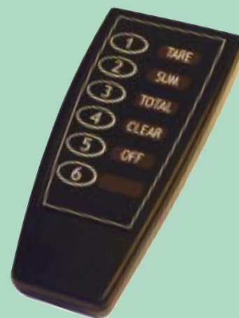
Commande à distance