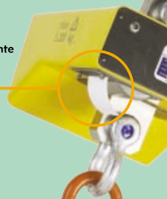
Imprimante dans le peson