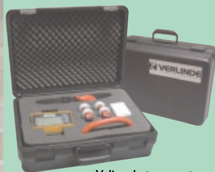
Valise de transport